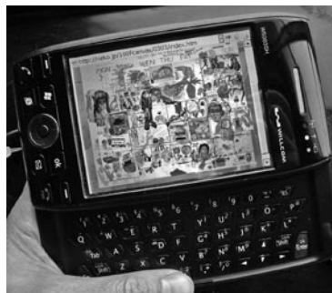
図4 スマートフォンに表示された100号キャンバス