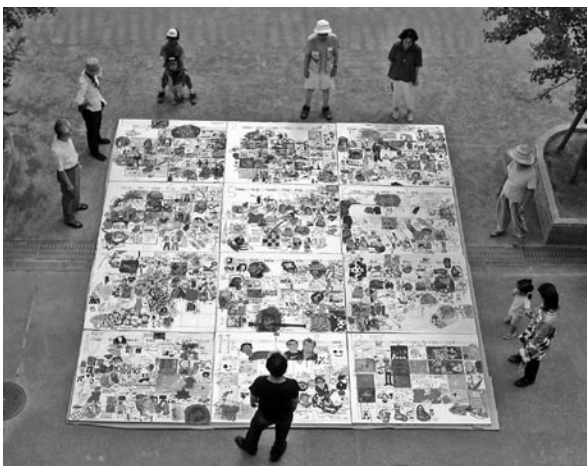
図2 廃校になった小学校の校庭に突然現れた奇妙なスケジュールと、遠巻きに集う人々

絵画作品のように、全体に意識を這わせた緊張感のある構図とは違って、独特な余白ばかりが目立つ。地塗りの均質な白が太陽光線を跳ね返して、飛行機