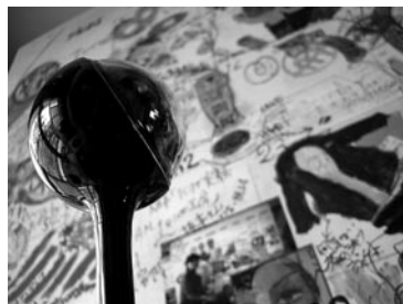
図5 キャンバスを凝視する、ネット接続されたウェブカメラ

の中にある経験や記憶の地形の複雑さとコントラストを十分に増幅させて、結果的に私の日常の解像度を飛躍的に高精細にしたように思う。