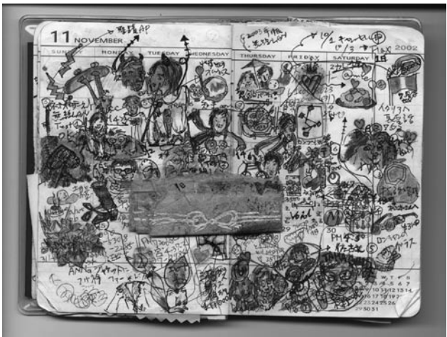
図1 1日分の枠がはちきれんばかりの情報であふれる手帳

帳を購入してしまう。そんな長年慣れた手帳に、二〇〇二年七月以降ちよつとした変化が起こった。